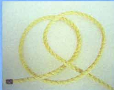
③右の輪を左の輪の上に重ねる。