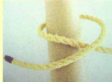
⑥一周巻きつけて交差するように上から重ねます。