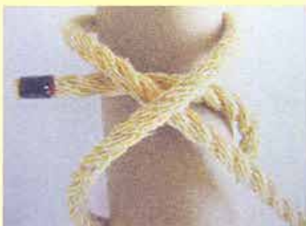
⑧ロープの先端を⑥でできている交差部分の下に通して引っ張れば、⑤と同じになります。