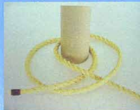
④真中の穴に杭などを通す。