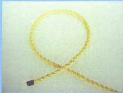
①輪を作る。交差の仕方に注意。