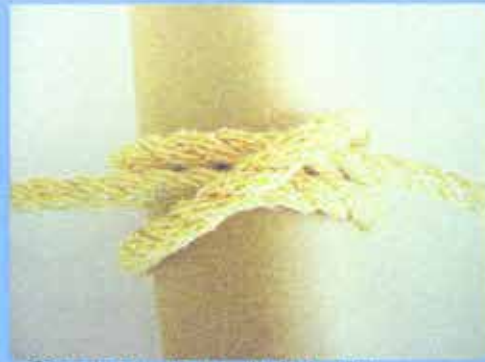
⑤両方引っ張ると出来上がり。