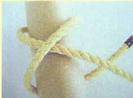
⑦もう一度くぐらせます。