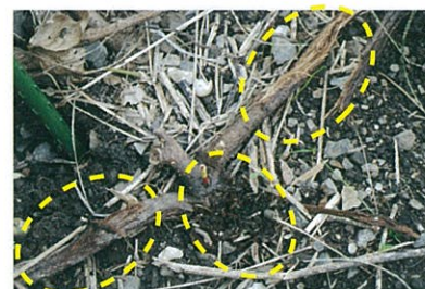
施用90日後のクズの根株。 茎、株が腐敗しクズが枯死しています。

処理後2~4週間で葉に黄化、褐変が見られ地上部が枯死します。地下部の枯死には3ヵ月程度要します。(遅効性)