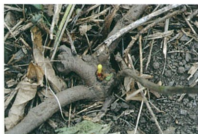
クズの根株に施用されたケイピンエース